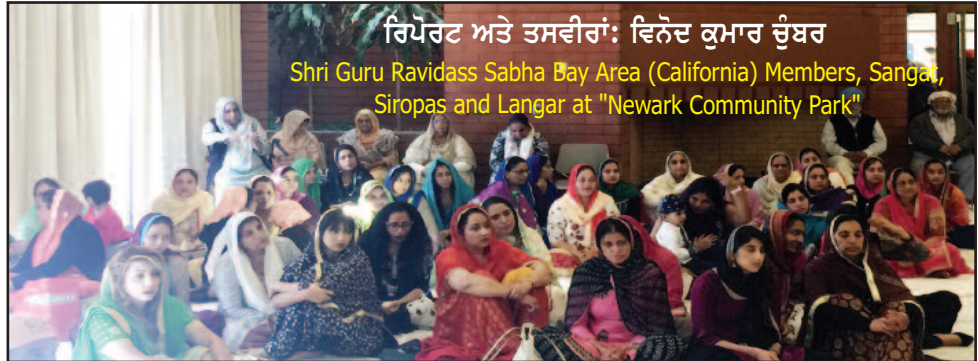
ਰਿਪੋਰਟ ਅਤੇ ਤਸਵੀਰਾਂ: ਵਿਨੋਦ ਕੁਮਾਰ ਚੰਬਰ Shri Guru Ravidass Sabha Bay Area (California) Members, Sangat, Siropas and Langar at "Newark Community Park"