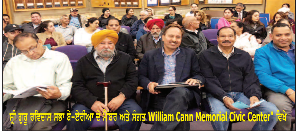
ਸ੍ਰੀ ਗੁਰੂ ਰਵਿਦਾਸ ਸਭਾ ਬੇ-ਏਰੀਆ ਦੇ ਮੈਂਬਰ ਅਤੇ ਸੰਗਤ "William Cann Memorial Civic Center" ਵਿਖੇ