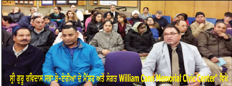
ਸ੍ਰੀ ਗੁਰੂ ਰਵਿਦਾਸ ਸਭਾ ਬੇ-ਏਰੀਆ ਦੇ ਮੈਂਬਰ ਅਤੇ ਸੰਗਤ "William Cann Memorial Civic Center" ਵਿਖੇ