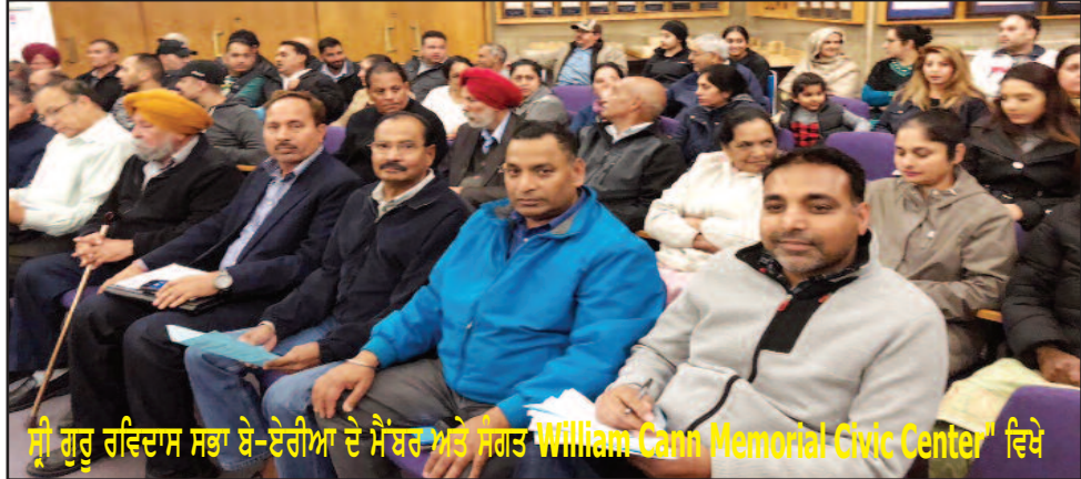
ਸ੍ਰੀ ਗੁਰੂ ਰਵਿਦਾਸ ਸਭਾ ਬੇ-ਏਰੀਆ ਦੇ ਮੈਂਬਰ ਅਤੇ ਸੰਗਤ "William Cann Memorial Civic Center" ਵਿਖੇ