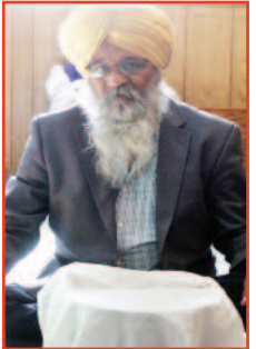
ਰਿਪੋਰਟ ਅਤੇ ਤਸਵੀਰਾਂ: ਪ੍ਰੇਮ ਕੁਮਾਰ ਚੁੰਬਰ (ਦੇਸ਼ ਦੁਆਬਾ)