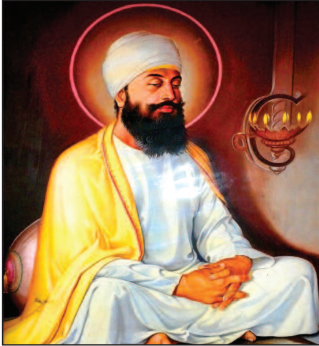
ਸ੍ਰੀ ਗੁਰੂ ਤੇਗ ਬਹਾਦਰ ਜੀ ਦੀ ਅਦੁਤੀ ਸ਼ਹਾਦਤ (ਜਸਵੰਤ ਸਿੰਘ ਅਜੀਤ ਦਾ ਵਿਸ਼ੇਸ਼ ਲੇਖ ਦੇਖੋ ਸਫ਼ਾ 16 'ਤੇ)

ਮੁੱਖ ਸੰਪਾਦਕ : ਪ੍ਰੇਮ ਕੁਮਾਰ ਚੰਬਰ ਸੰਪਾਦਕ : 916-947-8920 ਫੈਕਸ : 916-238-1393 E-mail : deshdoaba@yahoo.com ਸੰਪਾਦਕ : ਤਰਸੇਮ ਜਲੰਧਰੀ